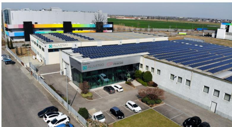
La sede di Vetraria Pescini e AluVetro

«Vetraria Pescini vuole affrontare nuove sfide, ambiziose e stimolanti, puntare sul know-how tecnico e sulla qualità delle persone che rappresentano i principali asset strategici su cui basare ogni nostra strategia di sviluppo. All'interno di questo disegno, le priorità aziendali si possano sintetizzare nell'efficiamento produttivo e nella maggior penetrazione commerciale, con focus sul cliente per rafforzare le partnership e le alleanze, come si sta già facendo attivamente con Glass Group di cui Vetraria è socio fondatore. Non manca una moderna visione del ruolo sociale dell'impresa e la grande attenzione a principi base di tutte le scelte aziendali orientate ad un futuro sostenibile. Sostenibilità a tutti i livelli: dal prodotto al processo, passando per le scelte quotidiane di dipendenti, collaboratori e fornitori» è il commento del manager.