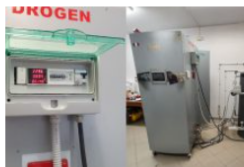
Dall'idrogeno la soluzione per le caldaie del futuro