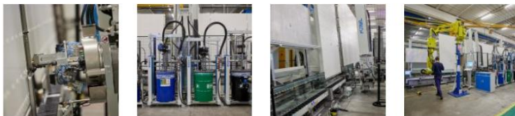
Vetraria Pescini | nuova linea sigillatrice Forel.

Vetraria Pescini opera nel pieno rispetto delle normative ed è sottoposta a un rigido protocollo di controllo sul processo e sul prodotto. I riferimenti sono diversi e presenti nella norma Uni En 1279-1;2;3;4;5: 2021 che fornisce indicazioni sui requisiti di utilizzo per vetrate isolanti e conformità nel tempo ai parametri di sicurezza visivi, energetici e acustici.