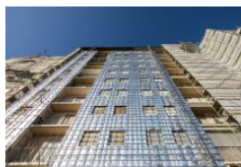
Boero torna protagonista a Klimahouse 2023 con soluzioni per esterni sempre più innovative